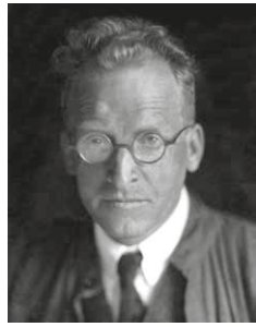
RICHARD RIEMERSCHMID 1868-1957

Ulmer Unternehmer und Bauherr der Villa Lindenhof