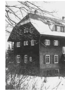
JÜDISCHES ALTERSHEIM 1939-1942

Pädagoge, Leiter des jüdischen Landschulheims Herrlingen