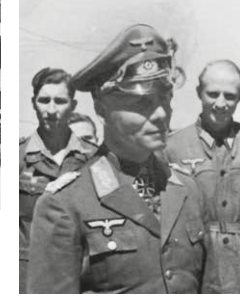
ERWIN ROMMEL 1891-1944