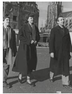
GRUPPE 47 2. TREFFEN 7.-9. NOV. 1947

Deutschsprachige Schriftstellergruppe, Gründung im Sommer 1947